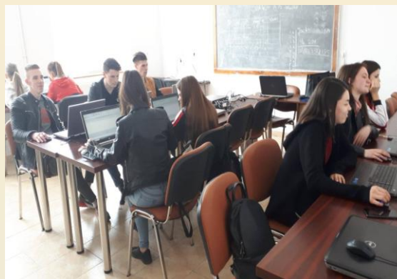
Laborator de informatică – Firma de exercițiu "BIOLUX" SRL