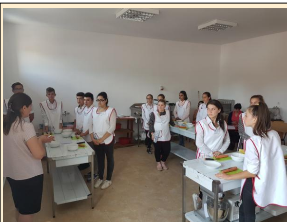
Practică în laboratorul de alimentație al școlii