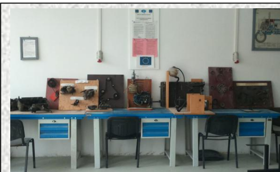
Laborator tehnologic Mecanică

Educarea și formarea profesională a tinerei generații, pentru facilitarea accesului, cu șanse egale, la o societate dinamică, integrarea pe piața muncii și în viața comunității.