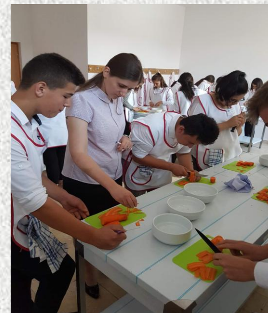
Alimentație publică și turism