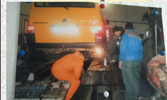
Practica la agenți economici Ateliere service auto